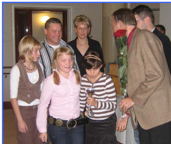
Vuoden juniorijoukkue -palkinnon sai Kankaanpään Mailan E-tytöt hienosta menestyksestä Sotkamon Tenavaleirillä.