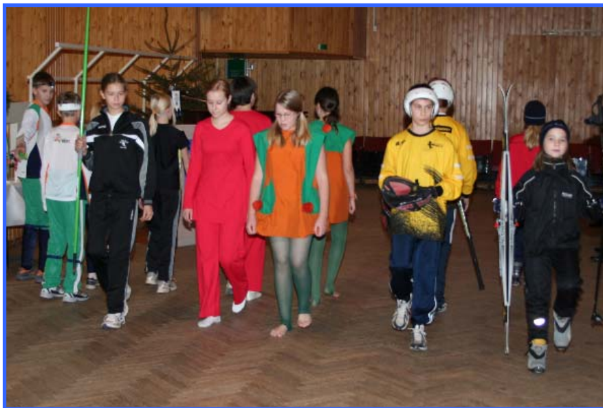
Urheiluseuran jaostoina toimivat yleisurheilujaosto, suunnistusjaosto, hiihto- ja ampumahiihtojaosto, palloilujaosto ja voimistelujaosto.

Palloilujaoston toiminnan tukena on suuri joukko ahkeria ja innokkaita talkoolaisia, joiden vastuulla on kesän toimintojen lisäksi bingon pyörittäminen ja Lallintalo-illat nuorisolle. Yhteistyökumppanit ja sponsorit ovat merkittävällä tavalla myös vaikuttaneet palloilujaoston toiminnan kehittämiseen ja ylläpitämiseen.